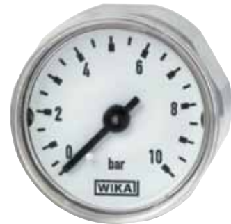
Миниатюрный манометр модель 111.12.27, низкие давления, опция корпуса из латуни, никелированный

Низкое давление: 0 ... 4 и 0 ... 25 бар Высокое давление: 0 ... 100 и 0 ... 400 бар а также соответствующие вакууметрические и мановакууметрические диапазоны