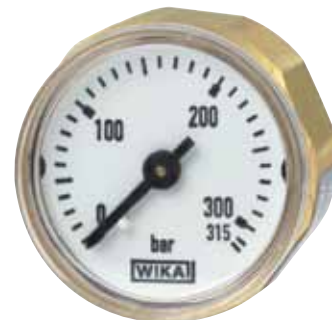
Миниатюрный манометр модель 111.12.27, высокие давлением