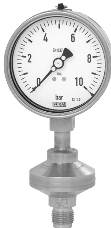
Separator membranowy model 990.34, Mb 52 mm przyłącze z gwintem zewnętrznym G ½ B, z manometrem model 232.50 NS 100

Patrz wykres rozkładu temperatury strona 3