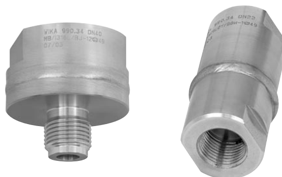
Model 990.34 Mb 40 mm Gwintzew. G ½ B