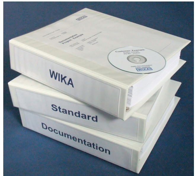
Стандартная документация WIKAI